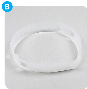
Teil B: größenverstellbares Befestigungsband Part B: size adjustable fastening strap