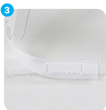
Jetzt die gewünschte Größe einstellen ... Now adjust your size ...