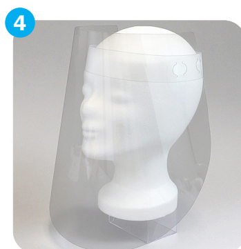
... und fertig ist das Gesichtsschild. ... and your face shield is ready.