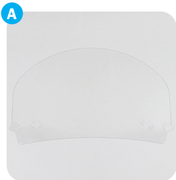
Teil A: Gesichtsschild Part A: face shield